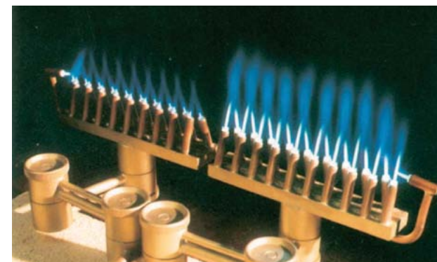
Brûleur spécial LINDOFLAMM®: chalumeau acétylène-air comprimé

La chaleur nécessaire au brasage à la flamme peut être apportée aussi bien avec des chalumeaux de soudage courants du commerce qu'avec des chalumeaux de chauffe multi-flammes. Les pressions et consommations de gaz sont indiquées dans les modes d'emploi respectifs. L'utilisation de chalumeaux de forme et de puissance spéciales (voici également le prospectus LINDOFLAMM®) se révèle souvent intéressante en brasage automatique.