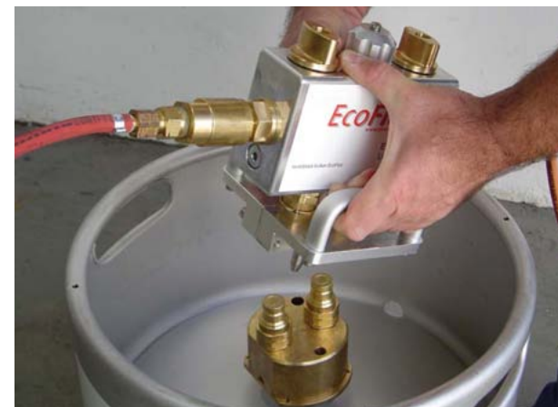
Bloc de vannes du flexible de gaz combustible à raccorder au mélange de flux

Les flux gazeux sont des flux fournis sous forme de gaz. Ceux-ci ne sont utilisables qu'avec le brasage à la flamme. Le gaz combustible passe à travers un mélange liquide volatil en s'enrichissant de flux. Le flux est ensuite transporté par la flamme sur les pièces, dont il élimine les oxydes. En brasage par capillarité, un flux doit être ajouté à la brasure. L'avantage de ce procédé réside dans la protection optimale des surfaces à braser durant le procédé tout entier, et dans la facilité d'élimination des résidus corrosifs avec de l'eau.