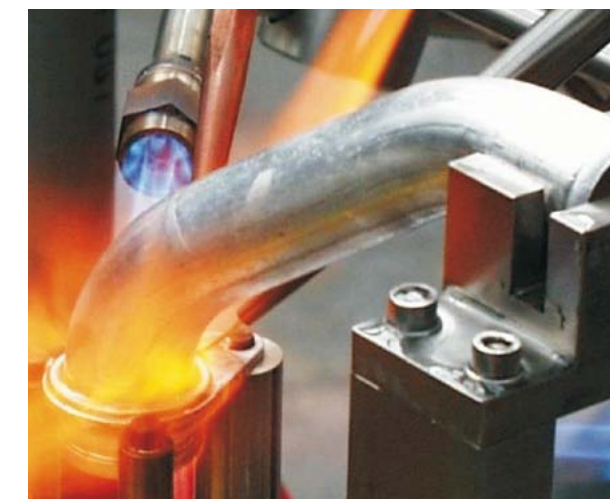
Brasage à joint capillaire avec apport automatique de brasure

Pour le brasage par capillarité, les pièces sont préparées de telle manière à présenter un faible jeu entre les surfaces à assembler. Lorsque la température de travail est atteinte, la fente se remplit essentiellement par la pression capillaire du métal d'apport. Cette variante du procédé est mise en œuvre tant pour le brasage manuel que pour le brasage partiellement mécanique et le brasage entièrement automatique.