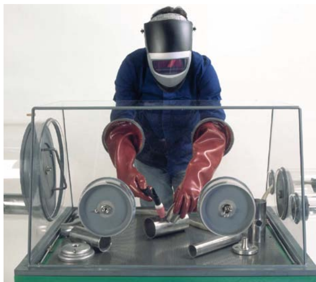
Chambre pour soudage sous atmosphère inerte.

Pour des matériaux réactifs tels que le titane ou le zirconium, il s'agit de protéger non seulement la zone de la racine, mais aussi la face supérieure du cordon derrière la soudure avec un sabot mobile. Il est également possible d'exécuter le soudage