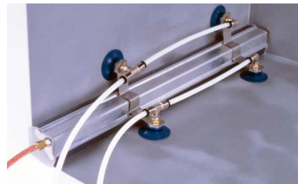
Dispositif de protection pour soudure d'angle

Pour les pièces de forme, des dispositifs de protection sur mesure peuvent être fabriqués par les fournisseurs en collaboration avec les fabricants.