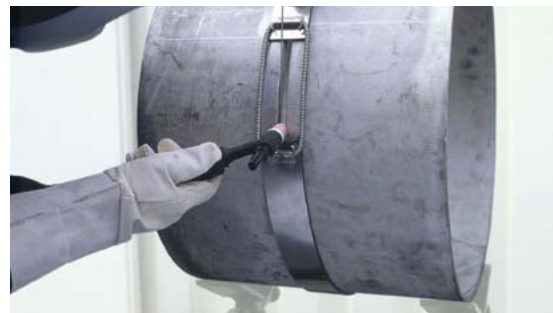
Fermeture du joint soudé durant le soudage

L'exemple se rapporte à une longueur de tuyau de 1 m et ne s'applique que si le gaz de protection se déplace lentement, régulièrement et sans turbulence de l'air présent dans le tuyau. Les dispositifs de protection ont par conséquent la fonction de limiter le volume dans la zone du cordon de soudure et de diriger le gaz de protection de façon régulière à travers un diffuseur en métal fritté.