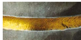
Acier inoxydable stabilisé au titane: Coloration jaune sous N 2 /H 2

x) Pour les aciers inoxydables stabilisés au titane, il peut se former en cas d'utilisation d'azote ou de mélange azote-hydrogène des nitrures de titane sur la racine soudée (jaunissement). La tolérance de ces nitrures de titane doit être définie de cas en cas.