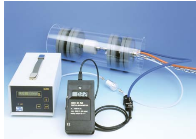
Dispositif de mesure de la teneur résiduelle en oxygène

Les conduites flexibles utilisées pour l'alimentation en gaz de protection jouent également un rôle important, car la perméabilité à l'humidité et à l'oxygène est tributaire du matériau utilisé. Les flexibles en caoutchouc avec armature textile et les conduites en Téflon donnent les meilleurs résultats. Pour le traitement de matériaux réactifs (comme le titane) et d'acier duplex, on utilise des tubes métalliques. Le contrôle des conditions d'exploitation et l'assurance qualité peuvent exiger la mesure de la teneur résiduelle en oxygène avant le pointage et le soudage. Les dispositifs de protection possèdent des raccords pour sondes de mesure. Des instruments spéciaux permettent de mesurer de faibles teneurs en oxygène, de l'ordre de quelques ppm, soit 1 seul atome d'oxygène par million.