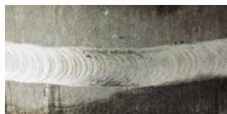
Acier inoxydable stabilisé au titane: Protection avec Ar/H 2