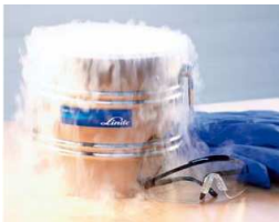
Glace carbonique et réservoir de stockage approprié

⇒ Dioxyde de carbone solide (glace carbonique)