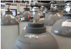
Bouteille de CO 2 pour prélèvement à l'état gazeux (sans tube plongeur)

Dans une bouteille de CO 2 sans tube plongeur, le dioxyde de carbone est prélevé directement dans la tête de la bouteille. Lorsqu'on ouvre le robinet, la pression diminue dans la bouteille. Le CO 2 en phase liquide se vaporise continuellement et s'échappe à l'état gazeux.