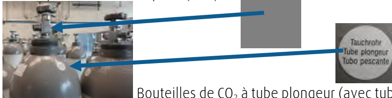
Bouteilles de CO 2 à tube plongeur (avec tube plongeur ou siphon)

A l'intérieur d'une bouteille de CO 2 de ce type, il y a un tube plongeur ou siphon qui va du robinet jusqu'à une très faible distance du fond de la bouteille. Pour autant que la bouteille soit en position verticale, le CO 2 prélevé à l'intérieur se trouve forcément à l'état liquide.