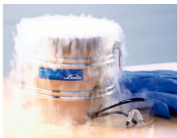
Glace carbonique et réservoir de stockage approprié

⇒ Dioxyde de carbone solide (glace carbonique)