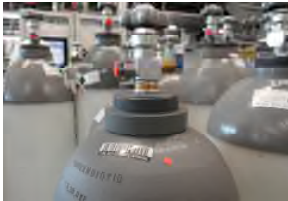
Bouteille de CO 2 pour prélèvement à l'état gazeux (sans tube plongeur)

Dans une bouteille de CO 2 sans tube plongeur, le dioxyde de carbone est prélevé directement dans la tête de la bouteille. Lorsqu'on ouvre le robinet, la pression diminue dans la bouteille. Le CO 2 en phase liquide se vaporise continuellement et s'échappe à l'état gazeux.